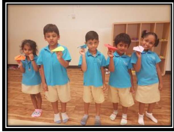
பிள்ளைகள் செய்த காகித விமானம்